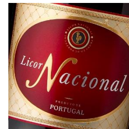
rótulo com o galo de barcelos